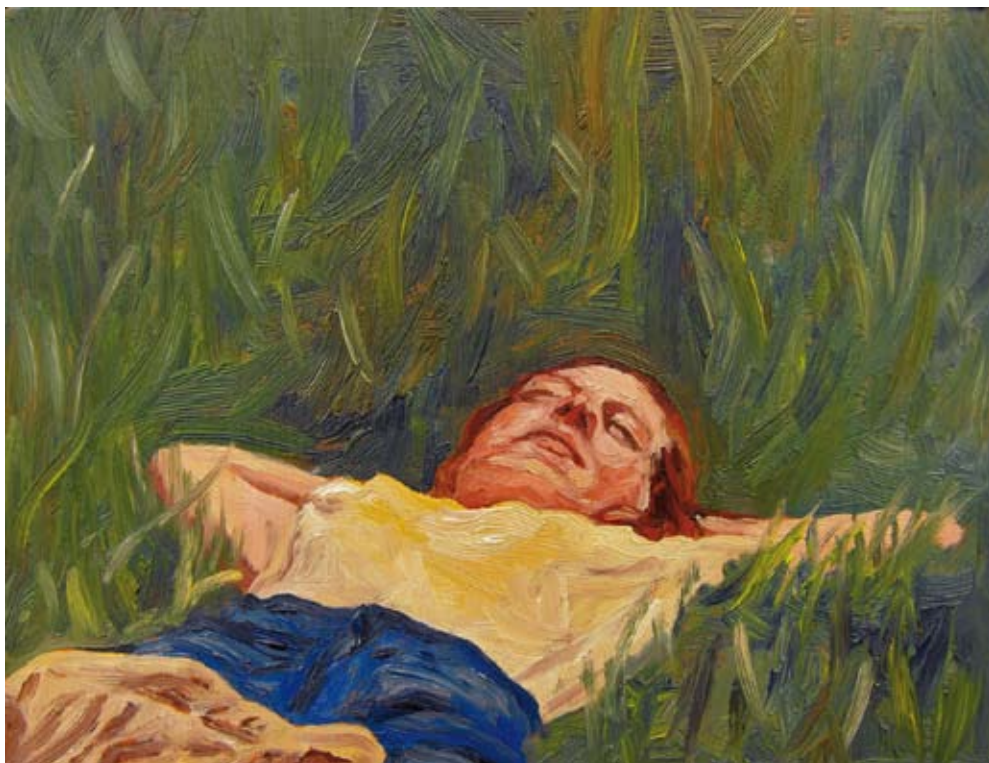
Eu Ich , 2009 Óleo s/ chapa de cobre Öl auf Kupfer 10,1 x 13,1 cm