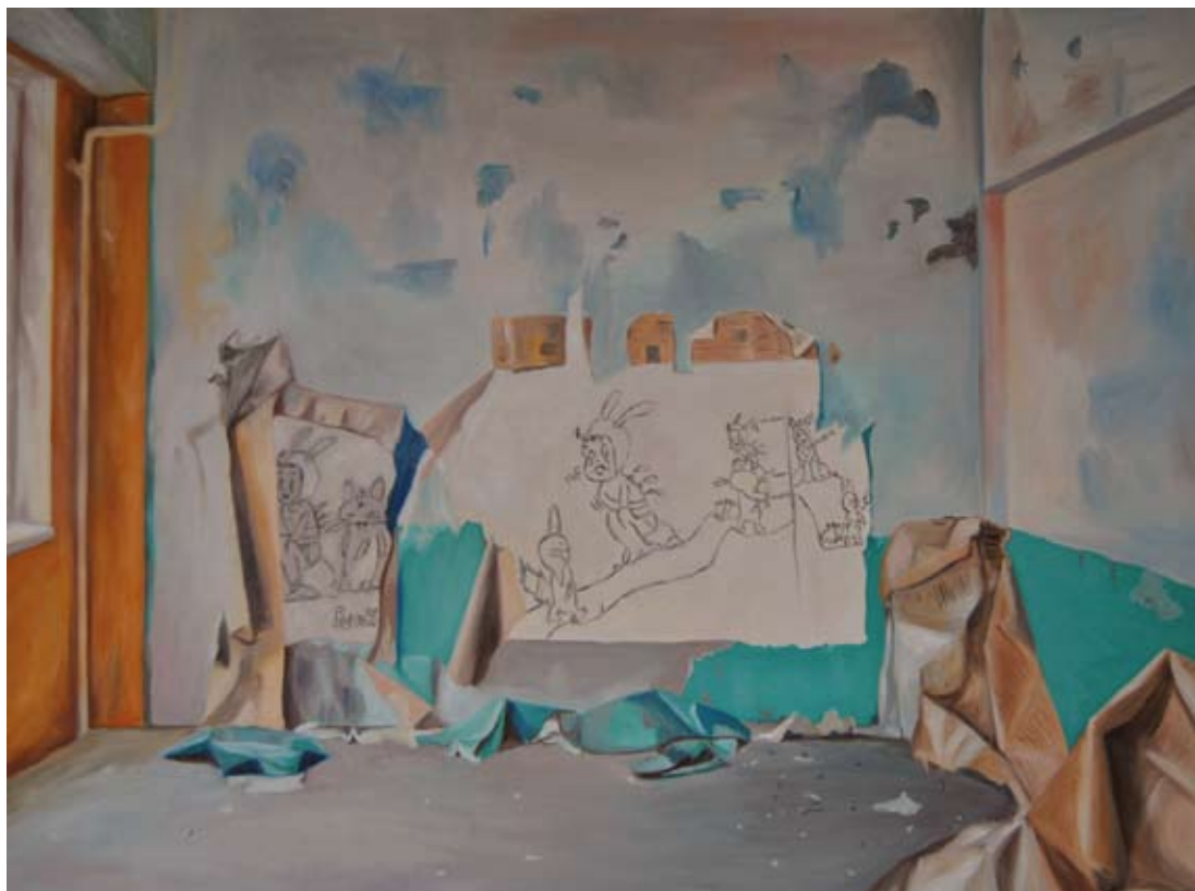
Rudi, 2009 Óleo s/ tela Ól auf Leinwand 80 x 100 cm