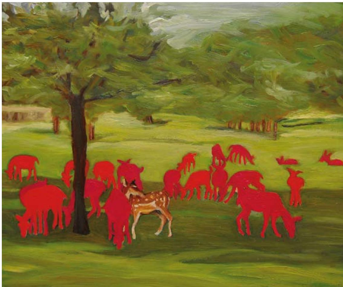
Prado Wiese , 2009 Óleo s/ chapa de cobre Öl auf Kupfer 12,8 x 15,5 cm