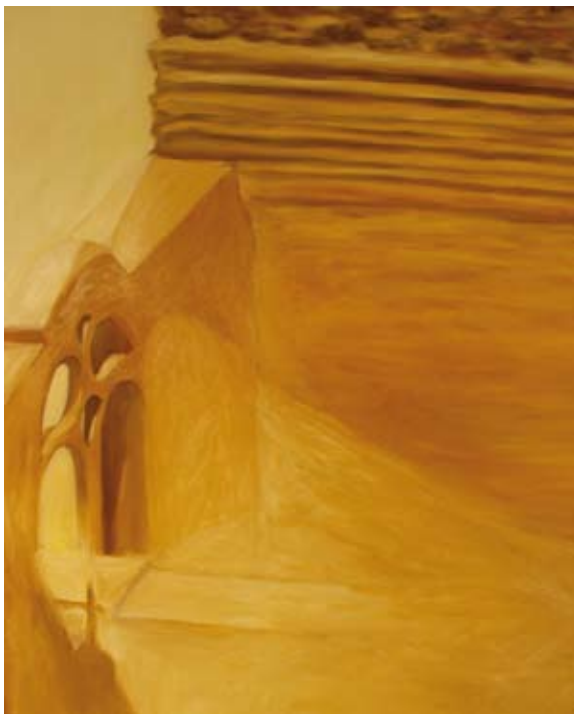
A luz no meu atelier Das Licht in meinem Studio , 2009 Óleo s/ tela Öl auf Leinwand 100 x 75 cm