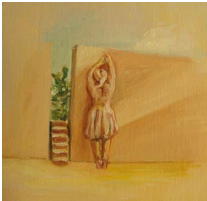
Detalhe imagem 4 Ausschnitt Bild 4

Página seguinte Nächste Seite Sem título Ohne Titel , 2009 Óleo tela Öl auf Leinwand 95 x 100 cm