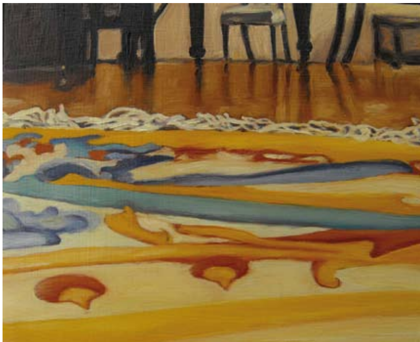
Sem título Ohne Titel , 2009 Óleo s/ chapa de cobre Öl auf Kupfer 9,5 x 12 cm