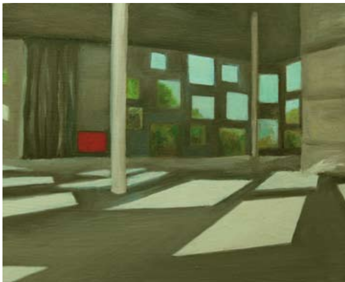
Sem título Ohne Titel , 2009 Óleo s/ chapa de cobre Öl auf Kupfer 8,1 x 9,6 cm