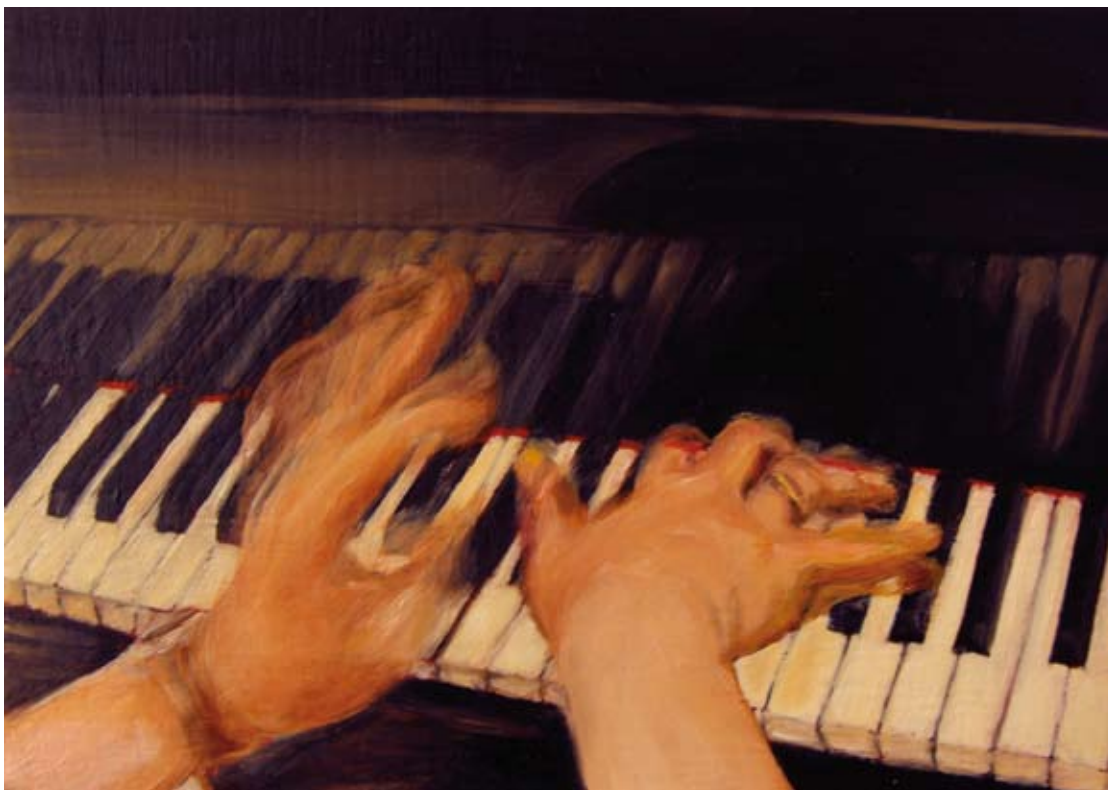
Alexander Eisenmann, 2009 Óleo e encáustica s/ chapa de cobre Öl und Wachs auf Kupfer 10,4 x 15cm